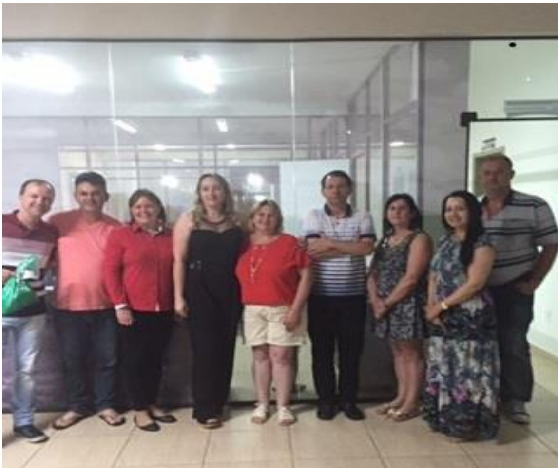
MENSAGEM DE NATAL DE AGRADECIMENTO